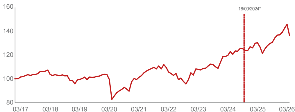
— Portefeuille 16/09/2024 : Changement de stratégie ESG.