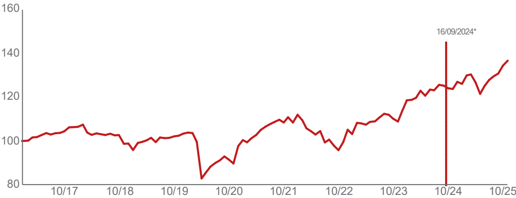
— Portefeuille 16/09/2024 : Changement de stratégie ESG.